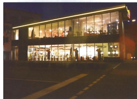
Abendliche Seitenansicht Café-Bistro...