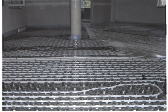
... und proKLIMA Systemboden mit Systemrohr