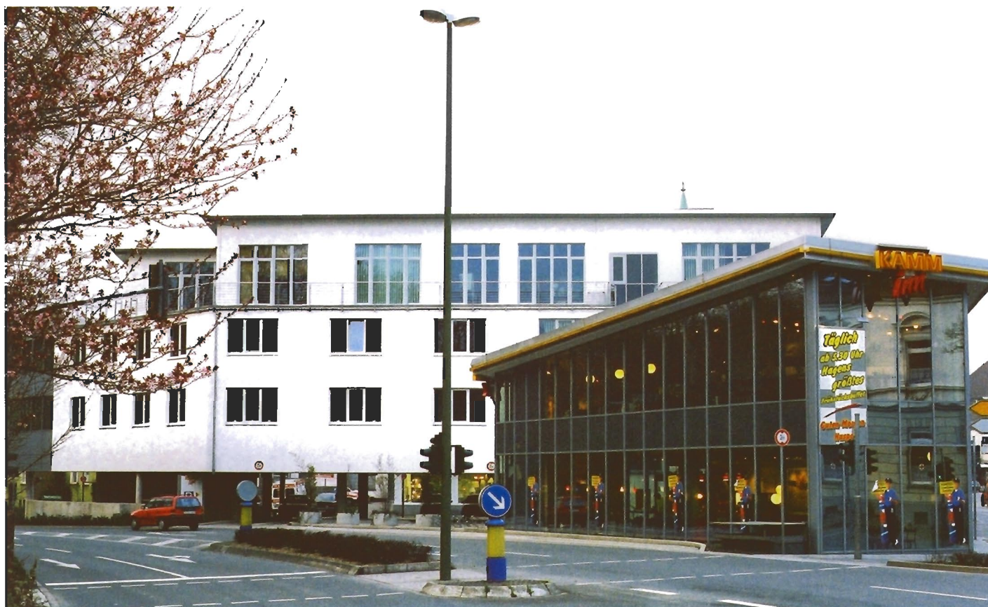
Überblick Bürogebäude und Café-Bistro