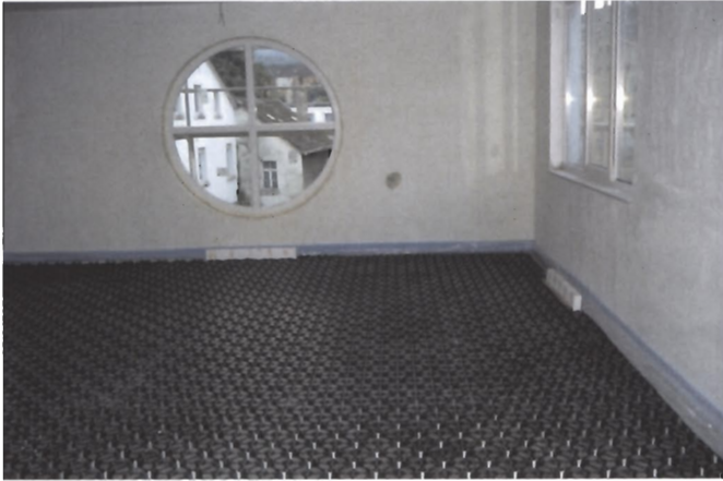
verlegter proKLIMA Systemboden mit Rohbaumontageblock